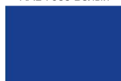
RAL 5017 Синий