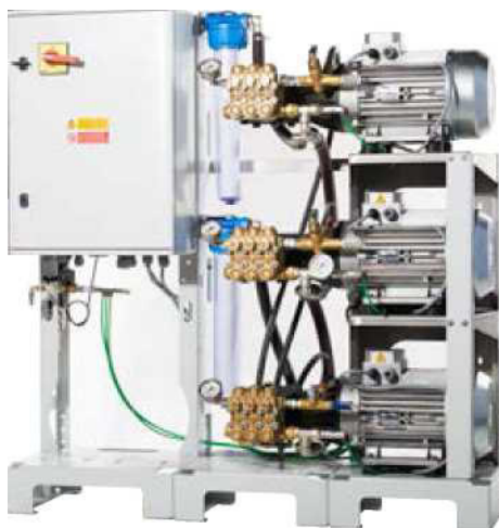
Стойка с 3 или 6 насосами высокого давления мощностью 7,5 кВт