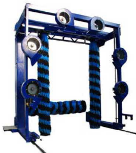
Дополнительная система сушки с 4 или 6 воздуходувками