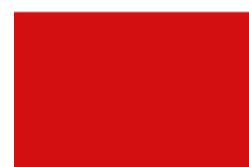
RAL 3020 Красный